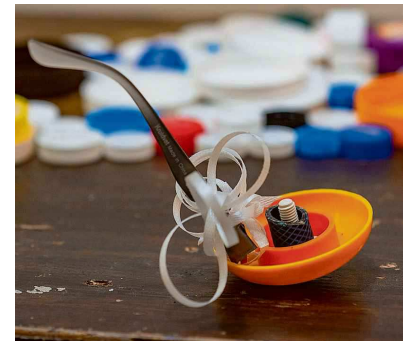
By Pypskoft hoort een pijp. Gemaakt uit een dopje van de vlaggenmast en het pootje van een bril.